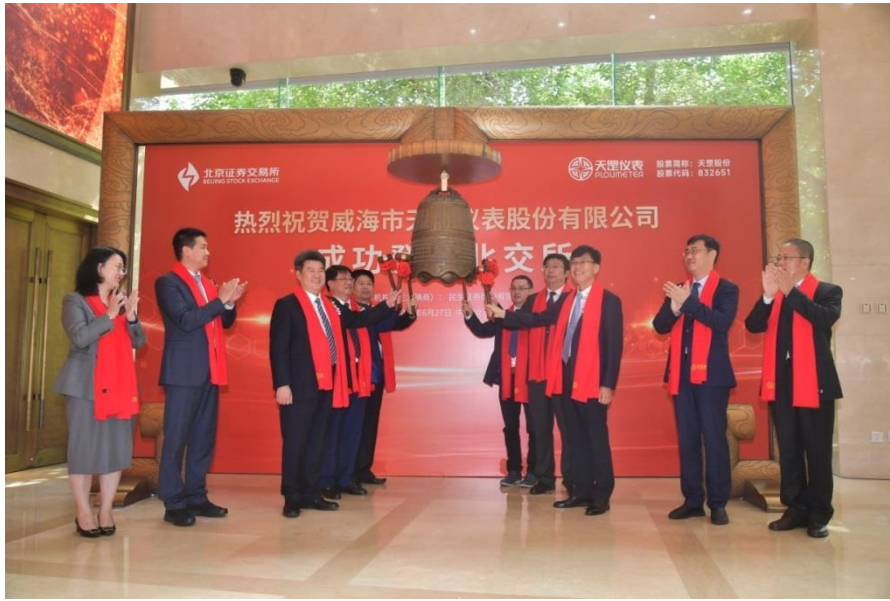
2023年6月27日，公司在北京证券交易所上市