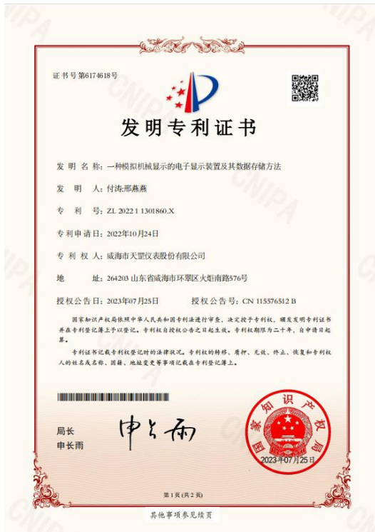
发明专利：一种模拟机械显示的电子显示装置及其数据存储方法